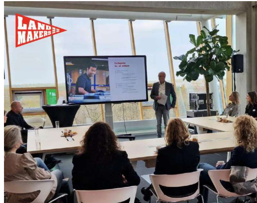
Collegiale in- en uitleen van technisch gekwalificeerd personeel

Het is van belang om samen te gaan werken en te laten zien wat wij als Land van de Makers te bieden hebben én wat de regio te bieden heeft.